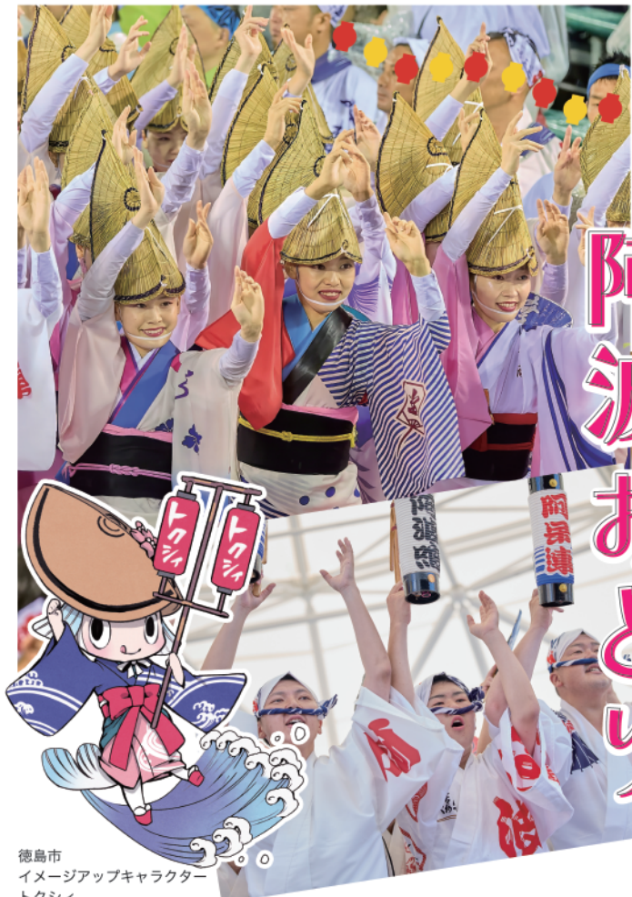
徳島市 イメージアップキャラクター トクシイ