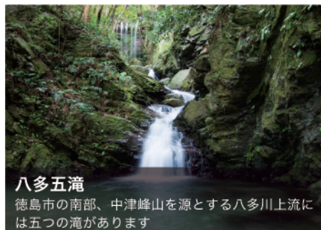
八多五滝 徳島市の南部、中津峰山を源とする八多川上流には五つの滝があります