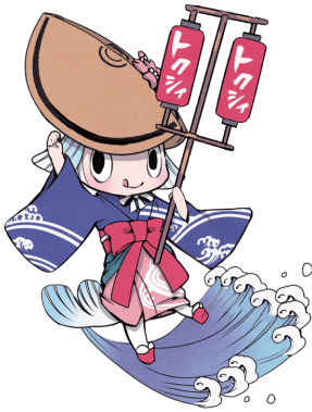
徳島市イメージアップキャラクター トクシ