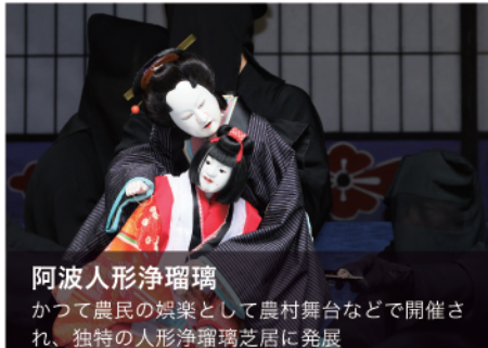
阿波人形浄瑠璃 かつて農民の娯楽として農村舞台などで開催され、独特の人形浄瑠璃芝居に発展