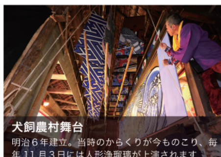
犬飼農村舞台 明治6年建立。当時のからくりが今ものこり、毎年11月3日には人形浄瑠璃が上演されます