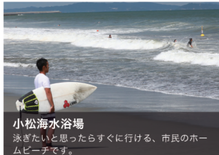
小松海水浴場 泳ぎたいと思ったらすぐに行ける、市民のホームビーチです。

徳島市のシンボル眉山が四季折々の風景を紡ぎ出す街、徳島市。夏の阿波おどりだけでなく、心はずむご当地グルメや、心ゆさぶる伝統文化など、数々の魅力があります。是非、ふるさと納税を通じて徳島市の魅力を感じていただきたいと思えます。