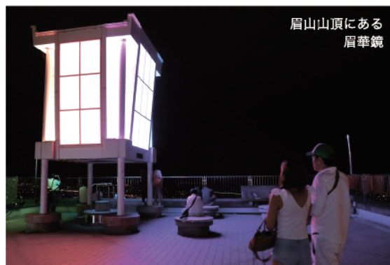
眉山山頂にある 眉華鏡