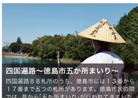
四国遍路～徳島市五か所まわり～ 四国遍路88札所のうち、徳島市には13番から17番まで五つの札所があります。徳島市民の間では、昔から「五か所まわり」が行われてきました。