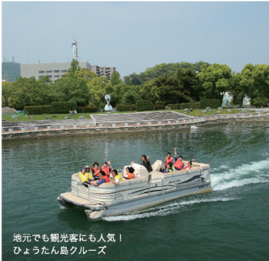
地元でも観光客にも人気！ ひょうたん島クルーズ

徳島市は、四国の東部に位置する人口約25万人（令和5年7月1日現在）の県都であり、四国一の吉野川をはじめ大小134もの河川が流れる、水と共に発展してきた「水都」です。中心部には万葉集にも歌われた「眉山」をはじめ、緑に恵まれた豊かな自然が残り、「阿波おどり」「人形浄瑠璃」など徳島の風土と歴史が育んだ個性的な文化や、「藍染・しじら」など特色ある伝統産業、さらには世界的に注目が集まる「LED」といった地域資源にも恵まれています。