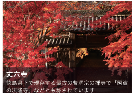
丈六寺 徳島県下で現存する最古の曹洞宗の禅寺で「阿波の法隆寺」などとも称されています