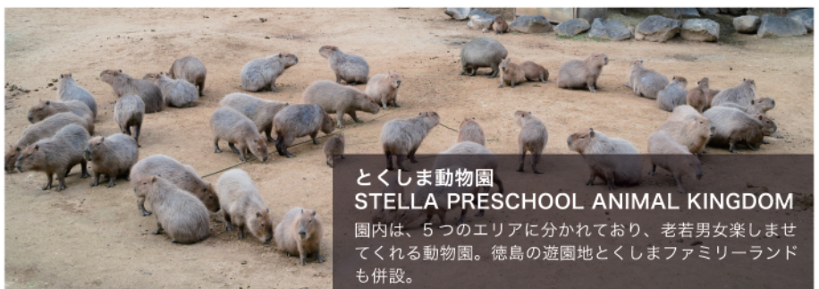
とくしま動物園 STELLA PRESCHOOL ANIMAL KINGDOM 園内は、5つのエリアに分かれており、老若男女楽しませてくれる動物園。徳島の遊園地とくしまファミリーランドも併設。