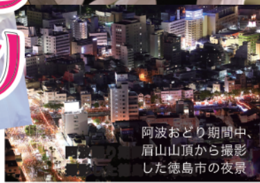
阿波おどり期間中、 眉山山頂から撮影した徳島市の夜景

徳島市のシンボル眉山が四季折々の風景を紡ぎ出す街、徳島市。夏の阿波おどりだけでなく、心はずむご当地グルメや、心ゆさぶる伝統文化など、数々の魅力があります。是非、ふるさと納税を通じて徳島市の魅力を感じていただきたいと思えます。