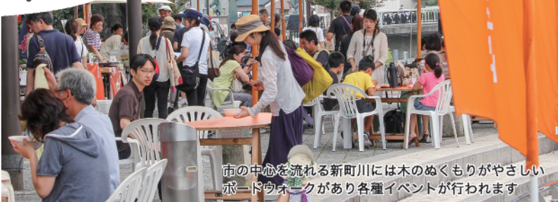
市の中心を流れる新町川には木のぬくもりがやさしいポッドウォークがあり各種イベントが行われます

市内の中心を流れる新町川・助任川に囲まれたエリアは、その形から「ひょうたん島」と呼ばれています。ひょうたん島周遊船で、周回約6キロを遊覧でき、水上から四季を楽しめます。 また、市内の中心を流れる新町川には、「LED」で飾られた4つの橋がかかっており、夜の散策スポットになっています。市内にそびえる眉山には、山頂へロープウェイが通じ美しい夜景を望むことができます。